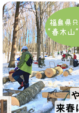
福島県只見町で “春木山”に参加

“春木山”は雪が締まった春先に山から木を伐り出す、搬出に重機を必要としない昔ながらの林業技術です。大変といえば大変ですが、春山での作業は気分爽快！来春の上越での開催も、いまから楽しみです^^