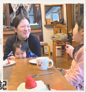
(誕生日のお祝い、大好きないちごのケーキで)

さてそんな牛田家ですが、宿を一棟貸しで再開するため、この度お引っ越しをすることに。引っ越しと言っても同じ区内・車で1分ですが、文字通り新生活のスタートです。新居の紹介はまた次回！